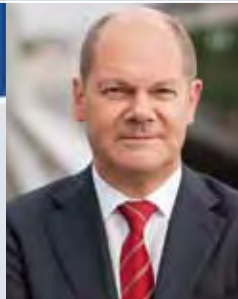
Olaf Scholz Erster Bürgermeister Freie und Hansestadt Hamburg